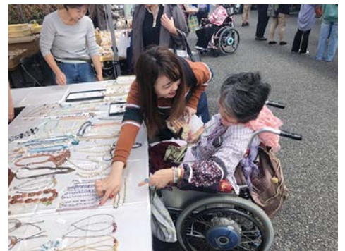
ご利用者の話を聞きながら、ベースに合わせて買い物をしています。