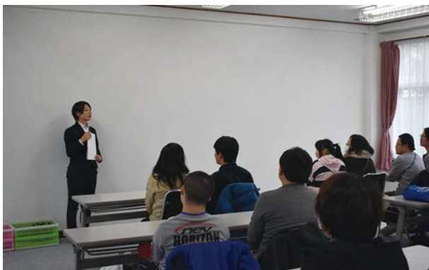
いよいよ始まります。