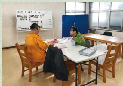
得意なことをいかして作業に励みます

外作業が苦手なご利用者に向けた室内での作業もあり、シュレッダーや回収チラシの折りなどを作業として取り入れています。 ひとりひとりの得意な事苦しい事を見極め、笑顔で頑張るご利用者を見ていただいている私たち職員もやりがいを感じます！！