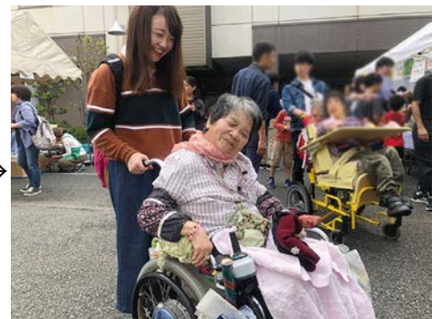
車椅子の移動もお任せください。