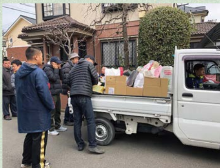
地域の皆様のご協力ありがとうございます

寒い日も暑い日も、雨が降っていても雪が降っていても負けずに作業に参加されています。外作業では、主に地域での資源物回収や資源物の納品作業、回収チラシのポスティングがあります。自閉症の方が多いためその特性を生かし、同じ作業を毎日繰り返す事で皆様集中して取り組むことができます。