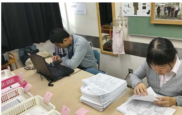
パソコンを使っでの仕事。ちょっと難しそうです。