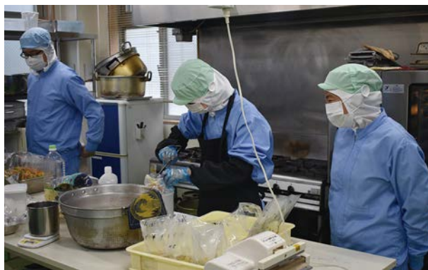
調理に入りました。分量を量って袋に入れます。