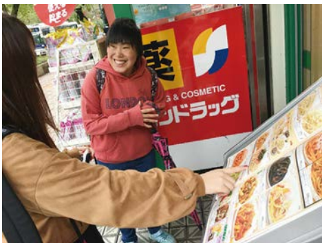
お昼ごはんのお店をどこにしようか、相談しながら決めています。