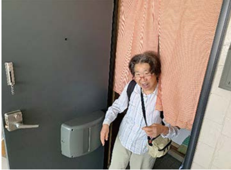
グループホームから出発です。今日もよろしくお願いします。