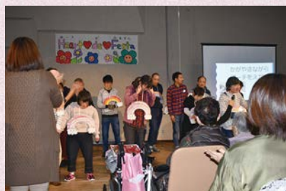
自作の虹の絵をかけて熱唱しました

※看板の「Heart de Festa」は、ご利用者の皆様か貼り絵で作成し、会場の方からも好評を頂きました！！ (記：希望園 鈴木)