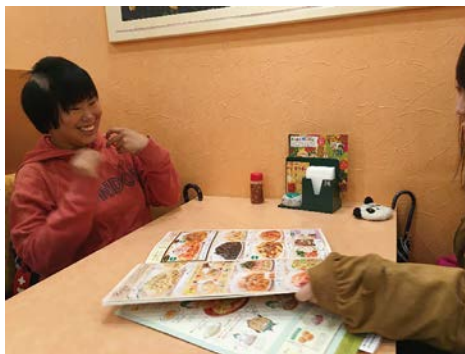
外での食事は大きな楽しみの一つです。