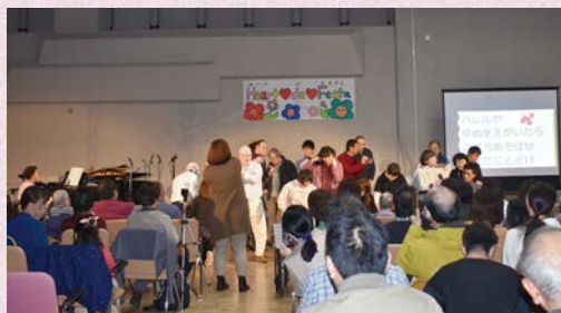
看板の文字、上手にできました！

令和元年11月23日（土）、本多公民館のグループ企画事業「baumクーヘン主催の「ハートdeフェスタ 音楽でつながろう」に希望園生活介護のご利用者の皆様と参加して来ました。この音楽発表会は