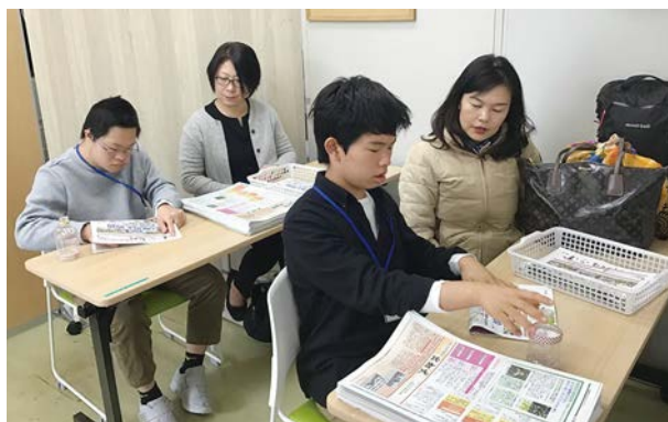
情報誌の折り作業です。折ったものをポスティングします。