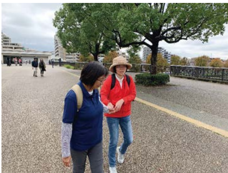
公園に到着いたしました。