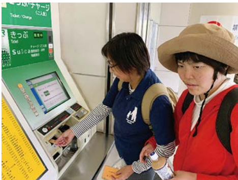
目的地を確認して一緒に切符を購入します。