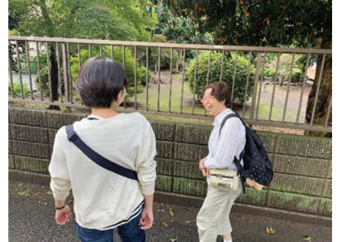
楽しかったですね。また一緒に行きましょう。

☆1日の出来事をご家族などへ報告しました。お金の管理も重要なガイドヘルパーの役割です。