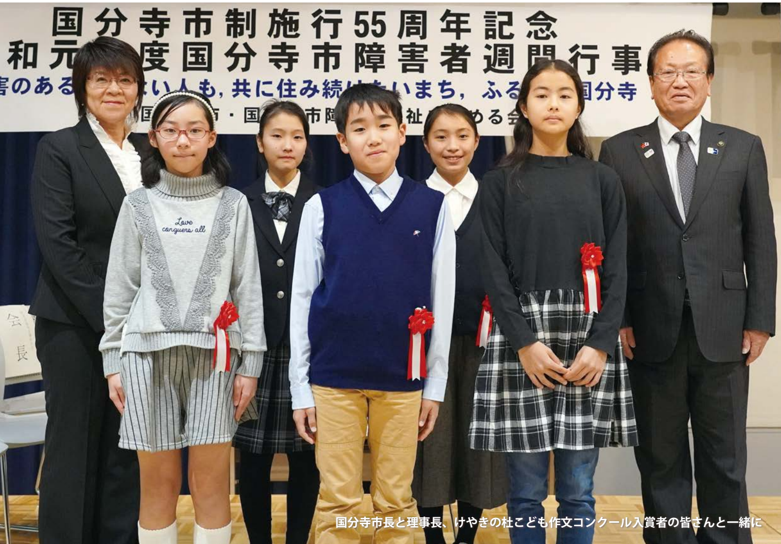
国分寺市長と理事長、けやきの杜子ども作文コンクール入賞者の皆さんと一緒に