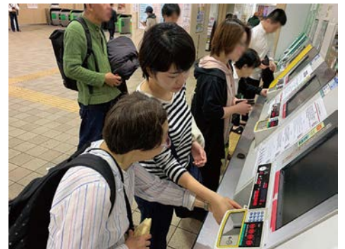
あっという間に帰りの時間になりました。電車に乗って帰宅します。